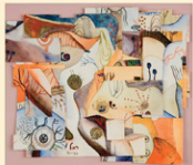
ב) האמונה בנוסח כל ילד

כל אדם זקוק לאמונה כדי לחיות! אי אפשר לאדם לחיות או לשרוד בלי אמונה. לאמונה מידך לתת בסיס ויכולת כדי שלא תוביל את האדם בדרך התחזים. כי מצד טבעו של כל נברא הוא מאמין במה שלפניו מונח. אם אינן ביוון נכון אדם יכול להתבטל לכל מיני רעיונות "אופטיים", חלופים והפזר לא רעיונים עד שמוכנים. כמה "אידיאות סוציאליסטיות", "קומוניסטיות", "עבודה זרה", "קפיטליסטיות", "ייאוש" וכו'.