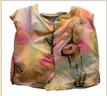
ט"ז / 1986