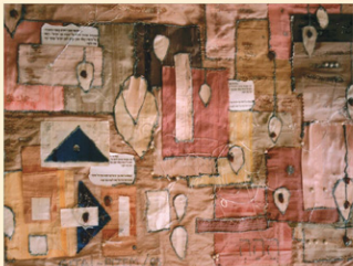
"יחי אדוננו מורנו ורבינו מלך המשיח לעולם ועד"